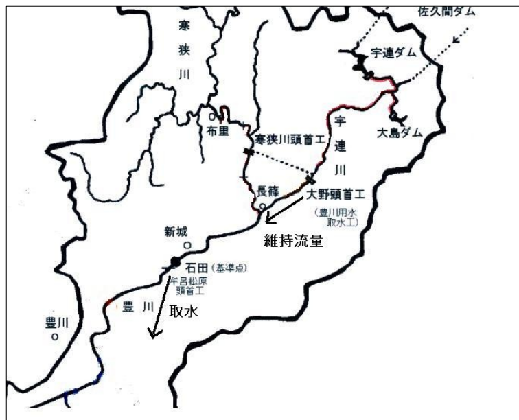
図3 流水の正常な機能の維持目的・・・ダムの建設目的にしてはならない

さらに、牟呂松原頭首工下流の維持流量を現在の2 m^3/s から5 m^3/s に引き上げる理由として、事業者が挙げている主な二点、アユの産卵条件の確保と下流の水道水源の塩水化防止については、現状の豊川の流況でどちらも特に問題は生じていない。アユ産卵場については漁協が整備活動を始めており、ダム建設ではなくこのような活動を支援することこそ必要とされている。長期の渇水が続いて仮に塩水で水道用水の取水に問題が生じる場合には、別水源への一時的切り替えによって対応できる。