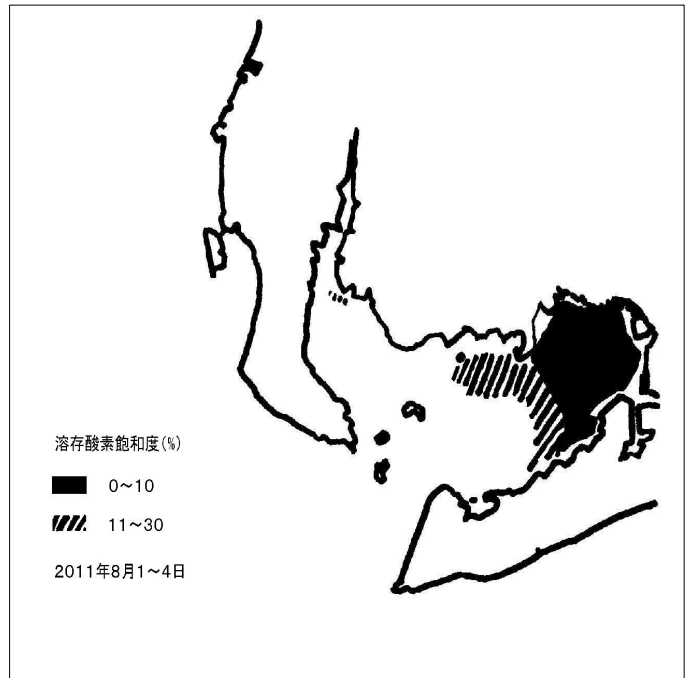
図4 夏の貧酸素水塊の発達は三河湾奥で著しい （愛知県水産試験場資料より）

設楽ダムの貯留水から水道用水を取水する必要はなく、愛知県は設楽ダムの使用権を返上すべきである。愛知県が水利権を返上することによって、特定多目的ダム『設楽ダム』建設事業は法的な根拠を失い、計画は白紙に戻る。ダム計画の解消によって東三河の母なる豊川を守り、里海三河湾の豊かさを取り戻す条件ができる。また、豊川水系取水量全体の65%を占めるかんがい用水の使い方を工夫すれば大幅な節水が可能で、渇水にも強くなれる。